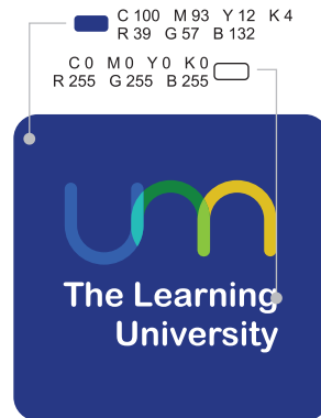
Logo di atas latar belakang biru