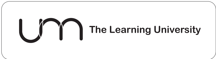
Warna dasar putih