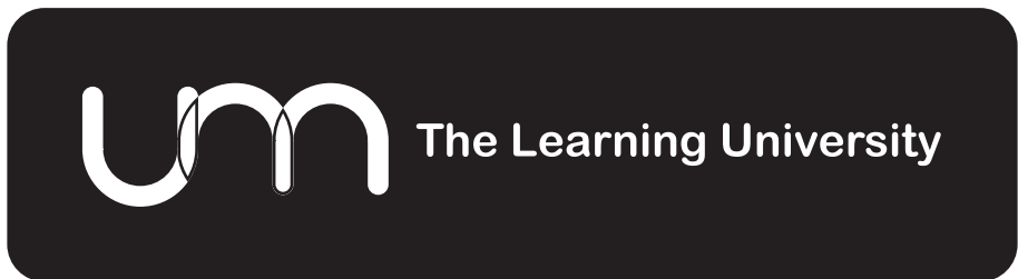
Warna dasar hitam