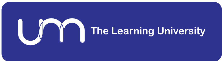
Warna dasar biru